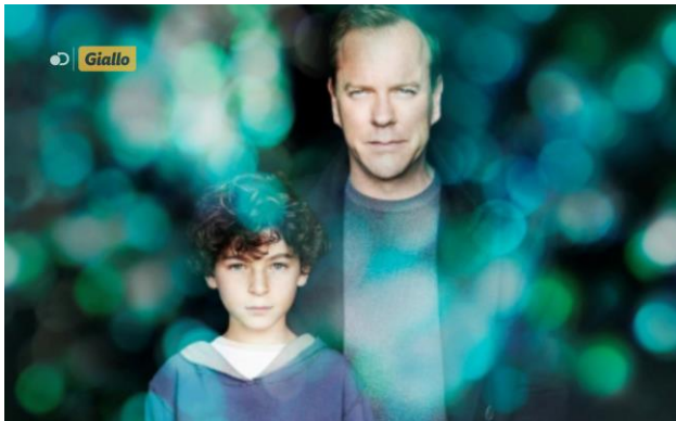
Un esempio di come appare il nuovo logo on air di Giallo