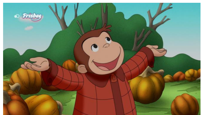
Un esempio di come appare il nuovo logo on air di Frisbee