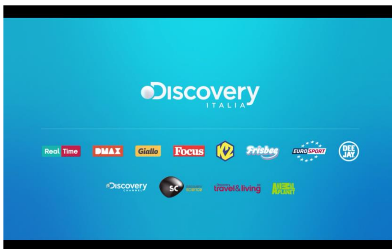
L'immagine coordinata del nuovo portfolio Discovery

Chiuso il 2014 con il 6% di share e la conferma della terza posizione in termini di ascolti, Discovery rafforza così il suo posizionamento sul mercato, sottolineando la centralità e i valori del proprio brand e la vocazione ad offrire una televisione con contenuti di qualità, aperta a tutti i generi: una programmazione che unisce emozione, curiosità, divertimento ed autenticità.