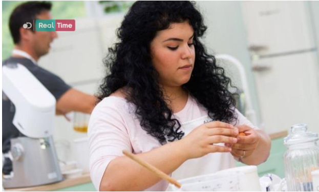
Un esempio di come appare il nuovo logo on air di Real Time