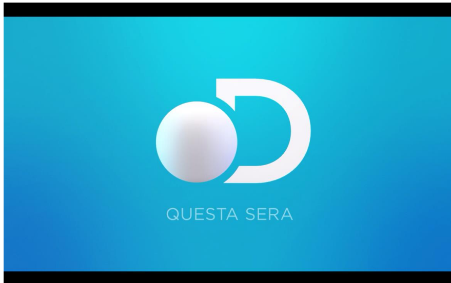
Il frame iniziale della clip che promuove la programmazione serale dei canali Discovery