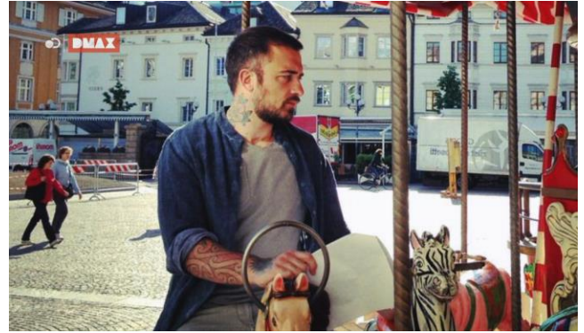
Un esempio di come appare il nuovo logo on air di DMAX