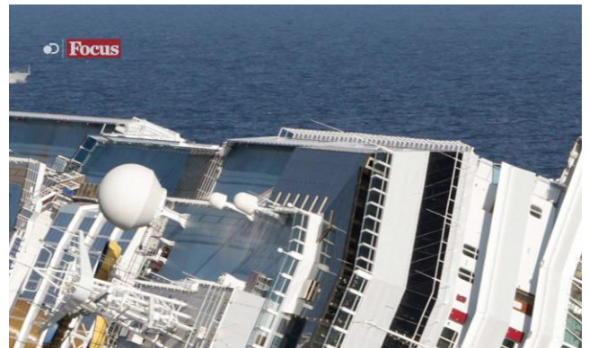
Un esempio di come appare il nuovo logo on air di Focus