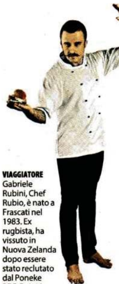
VIAGGIATORE Gabriele Rubini, Chef Rubio, è nato a Frascati nel 1983. Ex rugbista, ha vissuto in Nuova Zelanda dopo essere stato reclutato dal Poneke RFC. Poi si è trasferito in Canada. Nel 2010 si è diplomato all'ALMA, la scuola internazionale di cucina italiana. Dal 2013 collabora col canale di Discovery Dmax dove ha debuttato col format "Unti e bisunti". Tra i suoi programmi "I re della griglia", "Il ricco e il povero"