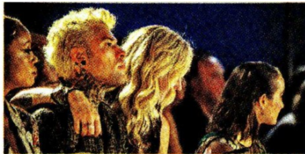
▲ Insieme Fedez, 30 anni, con la moglie Chiara Ferragni